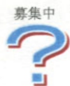
〔一般芸能音楽マーク〕